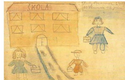
Kitty Brunnerová (26/12/1931-18/5/1944)